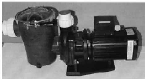
Pump &amp; Elmotor

Pumpar och filter i denna prislista finns normalt i vårt lager. Pumparna är CE-godkända och har skyddsklass IP-55. In- och utloppsanslutningar är anpassade för 1 1/2" eller 2" gänga för vidare koppling till 50 mm PVC-rör. Det finns ett stort urval av andra storlekar och utföranden, fråga oss om pris och råd.